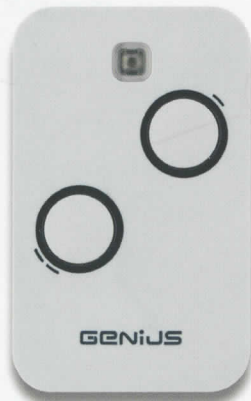
GE/6100332 Mhz 868