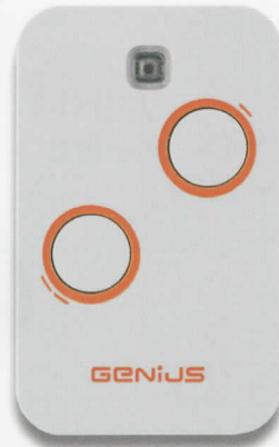
GE/6100330 Mhz 433,92

Nota: nella confezione di ogni telecomando sono contenute le spiegazioni dettagliate