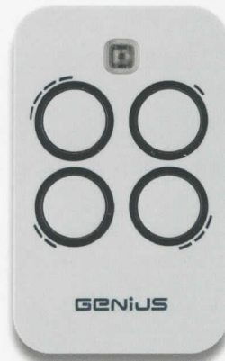
GE/6100333 Mhz 868