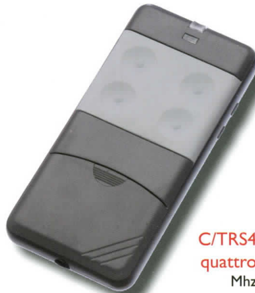
C/TRS435400 quattro canali Mhz 433,92