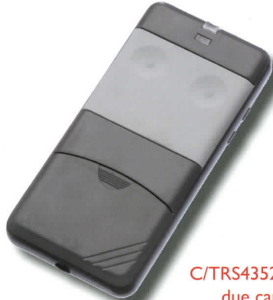
C/TRS435200 due canali Mhz 433,92

RICEVITORE CON CONTENITORE - ENCASED RECEIVERS - RÉCEPTEUR AVEC BOITIER - AUSSENEMPFÄNGER - RECEPTOR CON CONTENEDOR